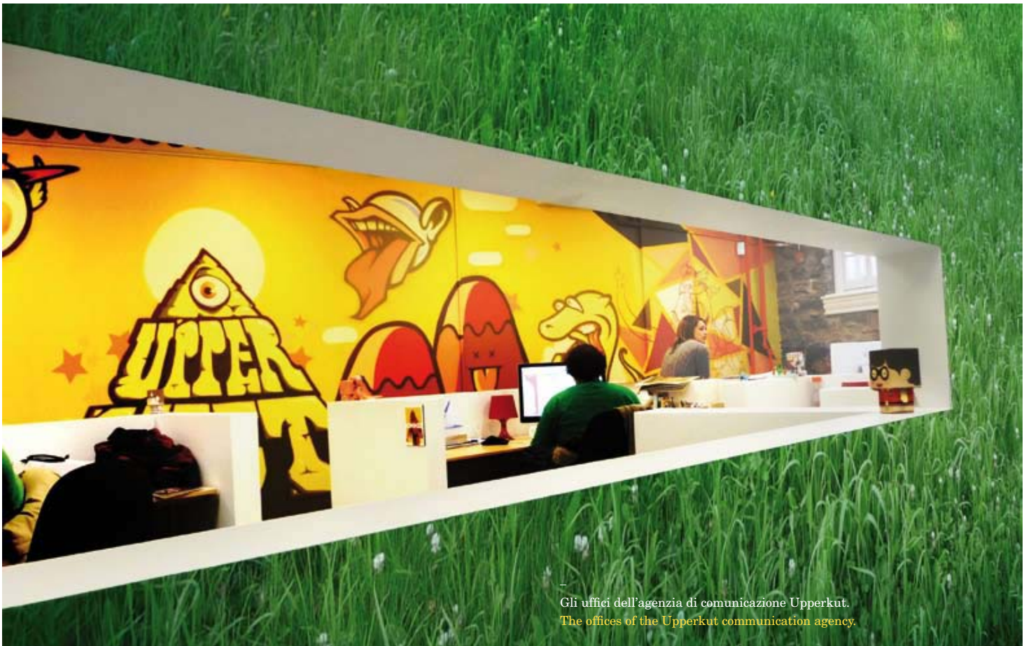
— Gli uffici dell'agenzia di comunicazione Upperkut. The offices of the Upperkut communication agency.