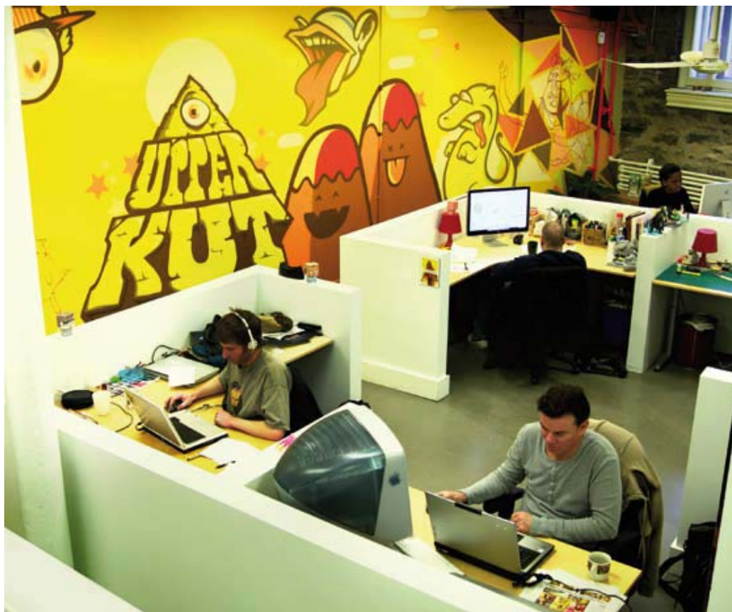
Vista degli interni. A view of the interior.

Per il designer, che vanta un'esperienza ultraventennale nel settore, si trattava di un'ottima opportunità per uscire dagli schemi e creare qualcosa di veramente straordinario. "Il seminterrato di una chiesa costituisce un luogo a dir poco